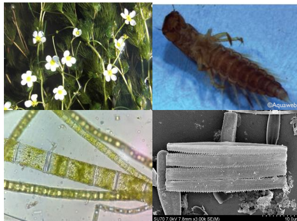
Alguns elementos biológicos considerados no projeto RIVEAL: macrófitos, macroinvertebrados, diatomáceas e macroalgas (sentido horário).