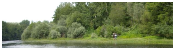
Alguns serviços dos ecossistemas das paisagens fluviais: recreação e valores estéticos.